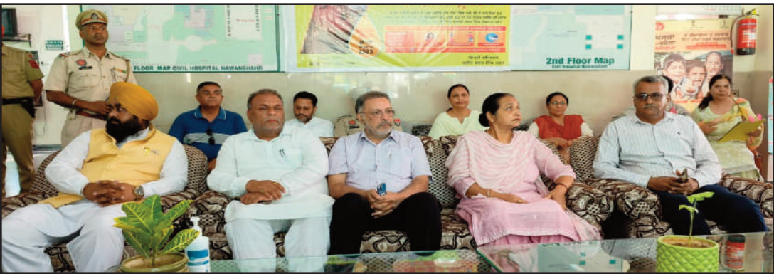
ਮਾਹਿਰਾਂ ਦੀ ਕਮੀ ਨੂੰ ਪੂਰਾ ਕਰਨ 'ਚ ਲੱਗੀ ਹੋਈ ਹੈ। ਉਨ੍ਹਾਂ ਕਿਹਾ ਕਿ ਸਰਕਾਰੀ ਸਿਹਤ ਸੰਸਥਾਵਾਂ 'ਚ ਢਾਚਾਗਤ ਲੋੜਾਂ ਤੋਂ 95 ਫ਼ੀਸਦੀ ਦਵਾਈ ਲਈ 'ਰੇਟ ਕੰਟ੍ਰੈਕਟ' ਤੈਅ ਹਨ ਅਤੇ

ਰਹਿੰਦੇ 5 ਫ਼ੀਸਦੀ 'ਰੇਟ ਕੰਟ੍ਰੈਕਟ' ਵੀ ਜਲਦ ਮੁਕੰਮਲ ਕਰ ਲਏ ਜਾਣਗੇ। ਉਨ੍ਹਾਂ ਕਿਹਾ ਕਿ ਆਉਣ ਵਾਲੇ ਸਮੇਂ 'ਚ ਸਰਕਾਰੀ