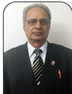
ਪ੍ਰੋ: ਐਚ. ਐਲ. ਕਪੂਰ

ਮੈਮੋਰੀਅਲ ਡੇਅ ਇਕ ਅਮਰੀਕੀ ਛੁੱਟੀ ਹੈ, ਜੋ ਮਈ ਮਹੀਨੇ ਦੇ ਆਖਰੀ ਸੋਮਵਾਰ ਨੂੰ ਮਨਾਇਆ ਜਾਂਦਾ ਹੈ, ਜੋ ਅਮਰੀਕੀ ਫੌਜ ਵਿਚ ਸੇਵਾ ਕਰਦੇ ਹੋਏ ਮਰਨ ਵਾਲੇ ਮਰਦਾਂ ਅਤੇ ਔਰਤਾਂ ਦਾ ਸਨਮਾਨ ਕਰਦੇ ਹਨ।