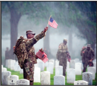
'ਅਮਰੀਕਾ ਦੇ ਮੈਮੋਰੀਅਲ ਡੋਮ ਦਾ ਇਤਿਹਾਸ' (ਵਿਸ਼ੇਸ਼ ਲੇਖ ਅੰਦਰ ਦੇਖੋ)